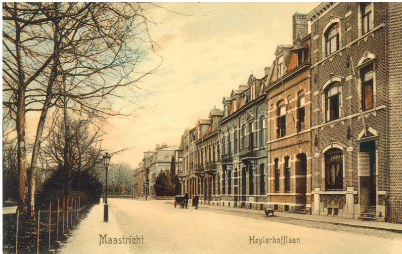
De Van Heylerhofflaan, gezien vanaf het huidige Henri Hermanspark. Ansichtkaart van circa 1910.