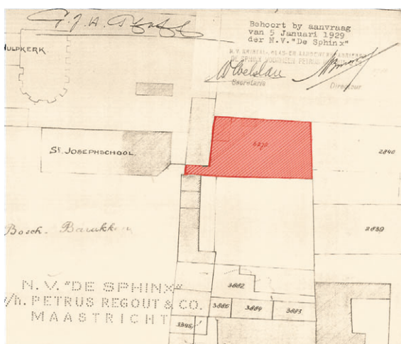
Het terrein van de voormalige begraafplaats in 1929, toen de Sphinx vergunning aanvraag voor de bouw van een overkapping.