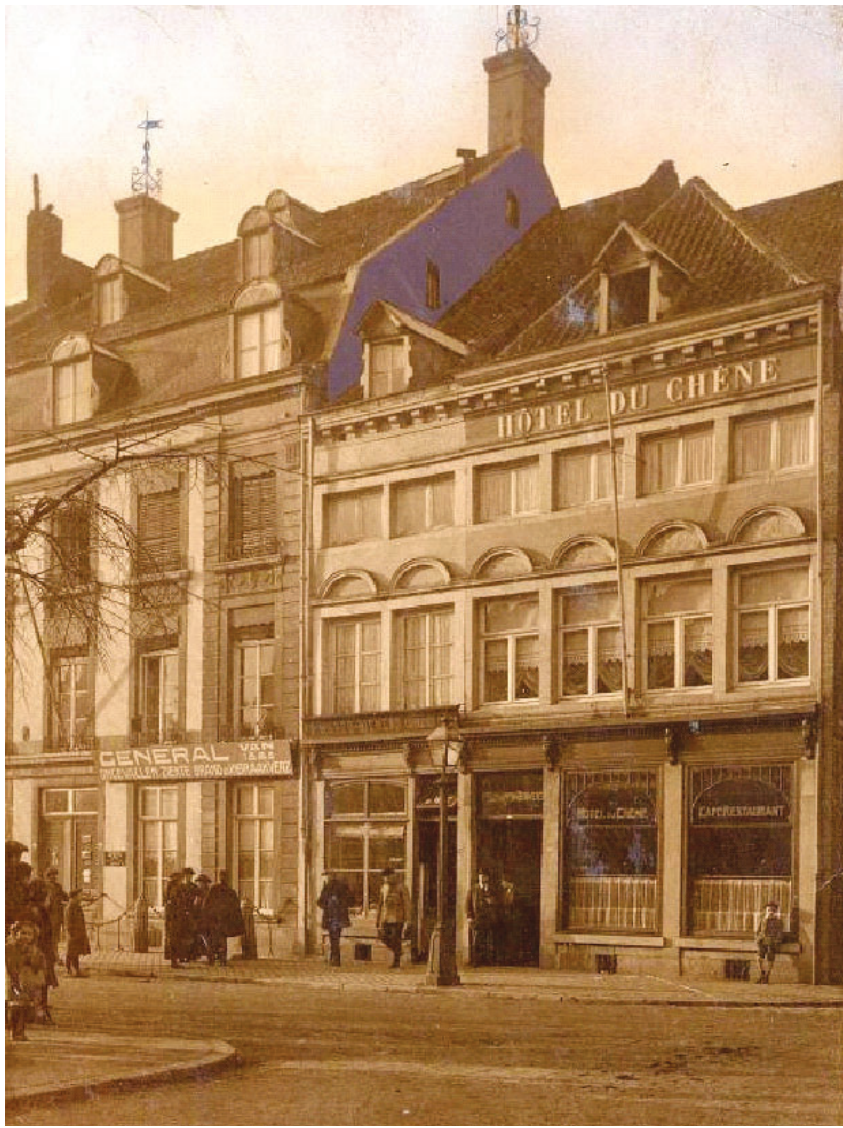
Ansicht van Hotel du Chêne aan de Boschstraat. Deze kaart dateert van 1905 of niet veel later.

In Nederland had de PTT het monopolie van de uitgifte van briefkaarten, maar maakte alleen standaardexemplaren zonder afbeelding. Je moest dus eerst een kaart bij de PTT kopen en daarop kon je dan een wens of een plaatje zetten. Kan-