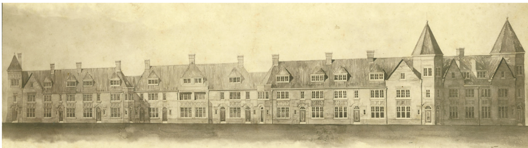
Het karakteristieke front met de drie torentjes van het complex van 66 woningen van Woningzorg ligt aan de Meerssenerweg.

Roersch was een taalgeleerde van grote verdienste, met grote kennis van zowel Sanskriet, Semitisch, Grieks en Latijn als van de moderne talen. Zijn publicaties getuigen van degelijke studie en zijn besprekingen van in Nederland, België, Duitsland en Frankrijk verschenen boeken werden hoog gewaardeerd. Zonder meer een standaardwerk was zijn geschiedenis van de filologie in België (filologie is de studie van de taal- en letterkunde van volkeren in samenhang met de cultuurgeschiedenis). Tenslotte was Roersch een van de achttien leden van de