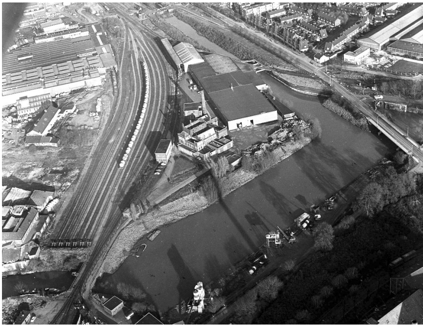
In het midden de fabriek van 'De Maas'. Rechts de Bosscherweg. De foto dateert van 1973, vijf jaar na de opheffing van het bedrijf.

hij wethouder openbare werken en als zodanig ook verantwoordelijk voor het gasbedrijf, de waterleiding, het busvervoer en