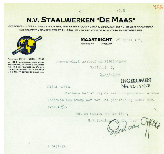
Niet alleen op de schoorsteen van de fabriek, maar ook boven het briefhoofd prijkte een kruis.

Bronnen: Archief Staalwerken 'De Maas' (SHCL). Literatuur: J.F.R. Philips, NV Staalwerken 'De Maas' (1963); J. Meihuizen, Noodzakelijk kwaad (2003); Historische Encyclopedie Maastricht.